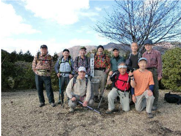
(シダンゴ山の頂上で全員集合です)