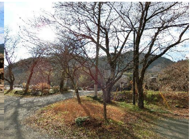
(左：宮地山、右：タコチバ山)