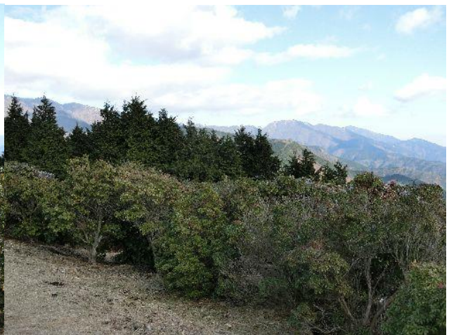
(丹沢の表尾根方向)