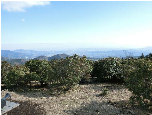
(小田原市街の方向)