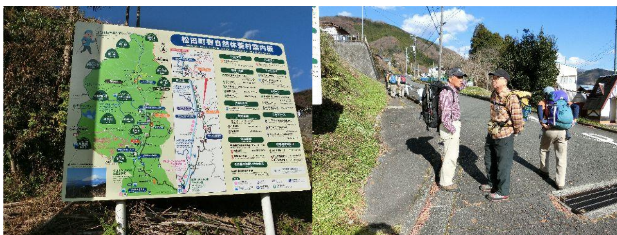
(宮地山～シダンゴ山のコースを確かめる)

小田急線・新松田駅に10名集合する。新松田駅前からバスで田代向まで行き、ここから登山開始する。お天気は晴の良い天気だ。