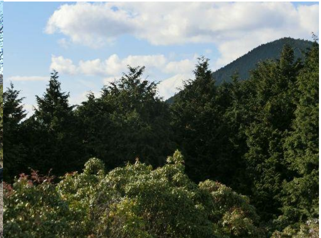
(高松山の奥に真っ白な富士山が見える)