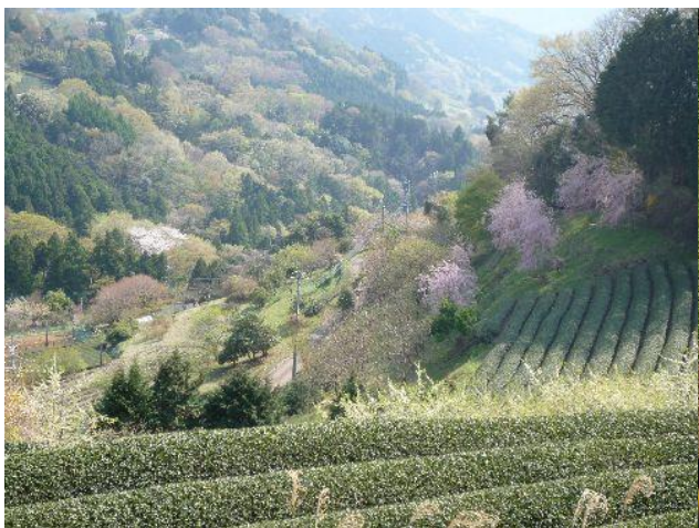
(土佐原の集落が見えてきました)