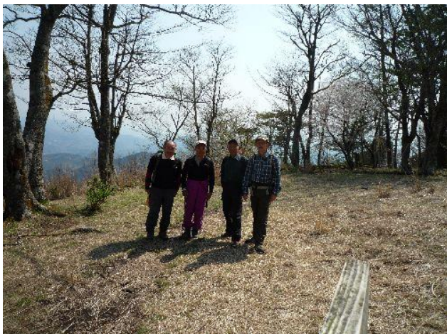
(明るい山頂の櫟山です)