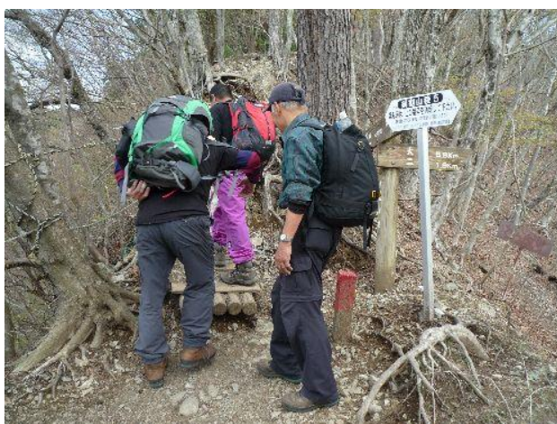
(後沢乗越ですが、誰も休もうと言いません)

いよいよ急な登山道を懸命に行くと、意外に早く後沢乗越に到着。 誰も休もうと言い出さず、そのまま歩き続ける。