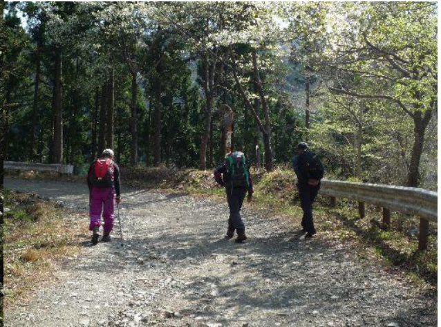
（しばらく四十八瀬川沿いの林道歩きです）

しばらく行くと大倉からの道と合流し二俣へと行く。さらに快適な林道を行き本沢の木橋を渡りやがてミズヒ沢出合の登山道入口に到着。