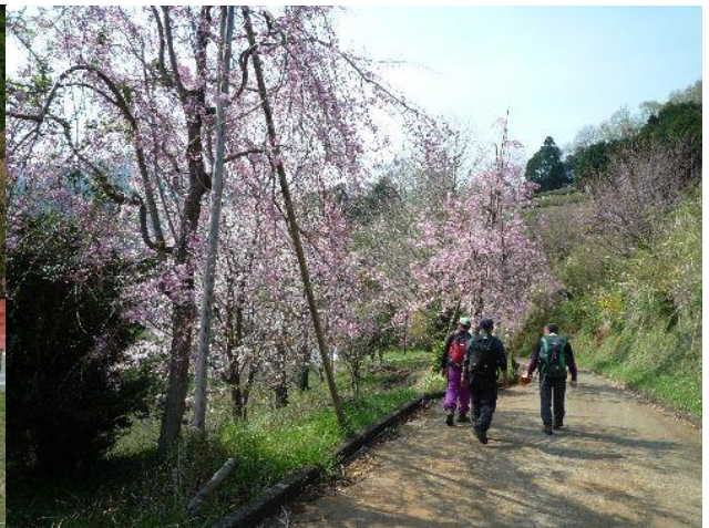
(桜並木の中を歩きます。いいね)

やがて寄の町に到着する。あいにくバスが出たばかりで1時間待ちとなった。 回りの山々を眺めていると1時間も短く、他の登山者も次々到着。