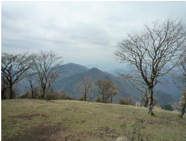
(まあまあのお天気ですね)