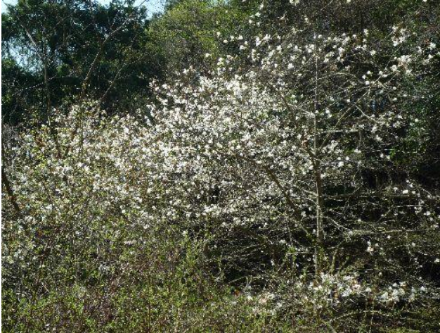
（コブシの花が咲いているね）

渋沢駅からタクシーで表丹沢県民の森まで入る（¥2,530）。ゲート前にて準備し、出発。