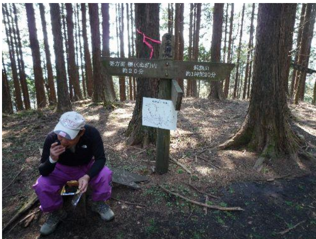
(杉林に覆われた栗ノ木洞の頂上です)