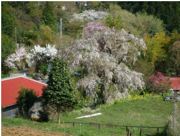
(里を象徴するしだれ桜)