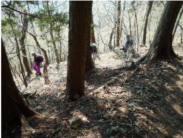
(急な下りとなってきました)