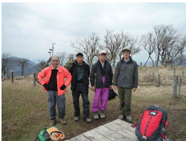
(鍋割山に到着です)

風が冷たく早々に上着を着こむ。記念撮影の後、鍋割山荘の中に入り名物の「鍋焼きうどん」頂く。 熱いうどんが体に沁みてうまい。