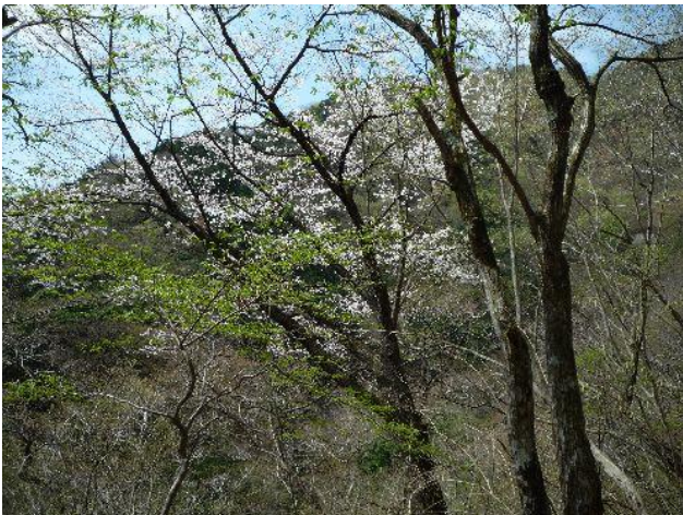
（山桜も咲きだしています）

しばらく行くと大倉からの道と合流し二俣へと行く。さらに快適な林道を行き本沢の木橋を渡りやがてミズヒ沢出合の登山道入口に到着。