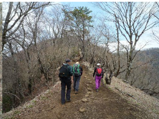
(気持ちの良い稜線歩き)

急な登りと平坦な尾根道を繰り返しながら、こんどは意外に長く感じれ、偽ピークにがっかりしながら なんとか鍋割山荘に到着。