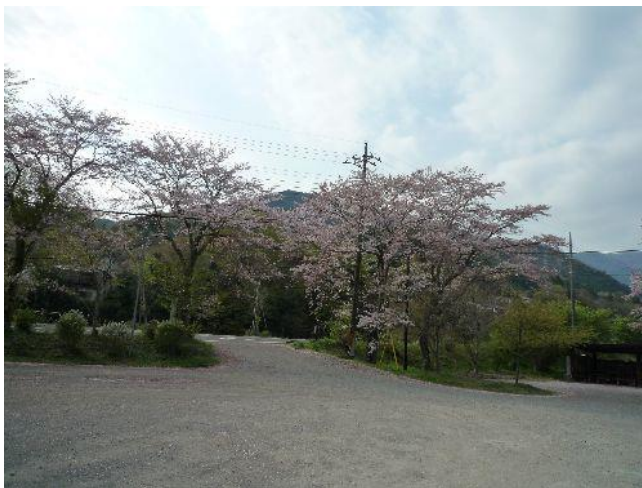
(寄に到着、桜の後方の山がシダゴ山)

やがて寄の町に到着する。あいにくバスが出たばかりで1時間待ちとなった。 回りの山々を眺めていると1時間も短く、他の登山者も次々到着。