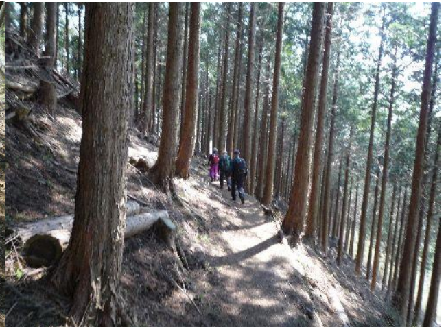
(杉林の中を下っていきます)