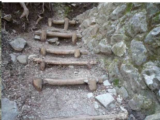
(いよいよ登山道です)

いよいよ急な登山道を懸命に行くと、意外に早く後沢乗越に到着。 誰も休もうと言い出さず、そのまま歩き続ける。