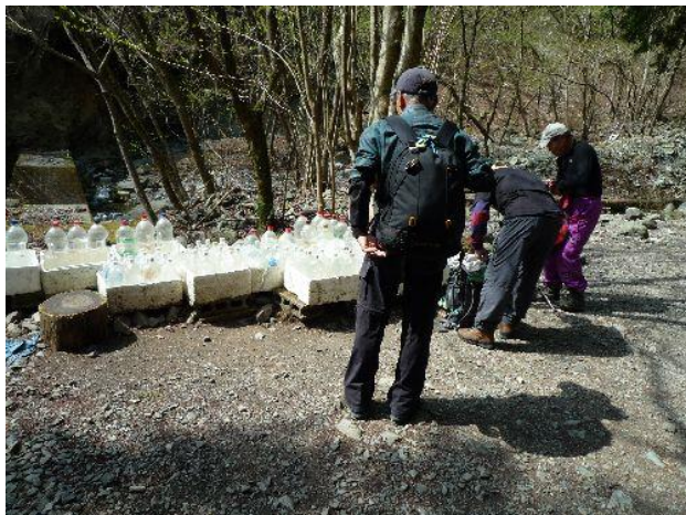
(鍋割山荘の水運びに協力します)

ここでお約束の鍋割山荘への水運びに協力することにし、1Lのペットボトルをザックに入れる。