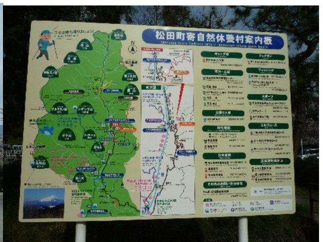
(見どころがたくさんありますね)

次のバスで新松田駅に向かった(¥520)。 新松田駅前の飲み屋さんにて恒例の「山行反省会」を行い、それぞれ家路に着いた。