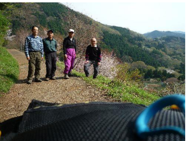
(桜を背景にしたつもりの記念撮影)