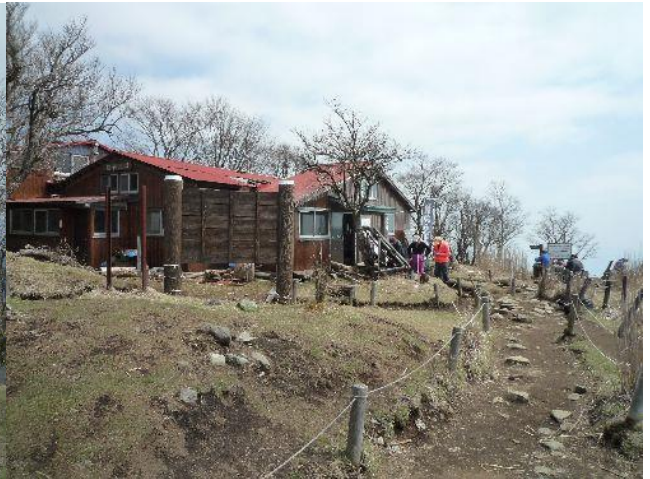
(鍋割山荘で鍋焼きうどんを頂きました)