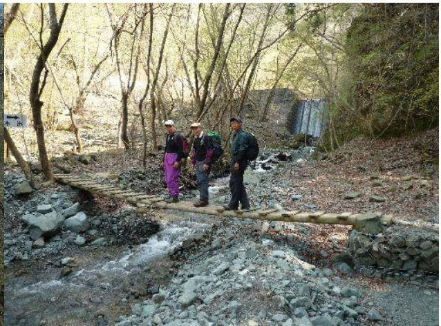
（本沢にかかる木橋の上で。みんな元気です）