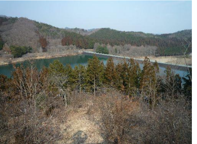
(展望台からの眺め)

森林公園で一休みし元の舗装道に戻り、森林公園入口バス停から宇都宮駅に戻る。駅前にて本日の山行の無事に感謝し二人で祝杯を挙げた。