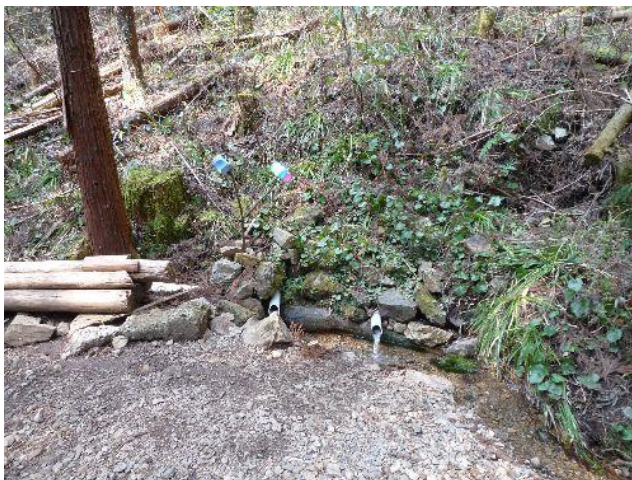
(美味しい水の湧き出る水場)