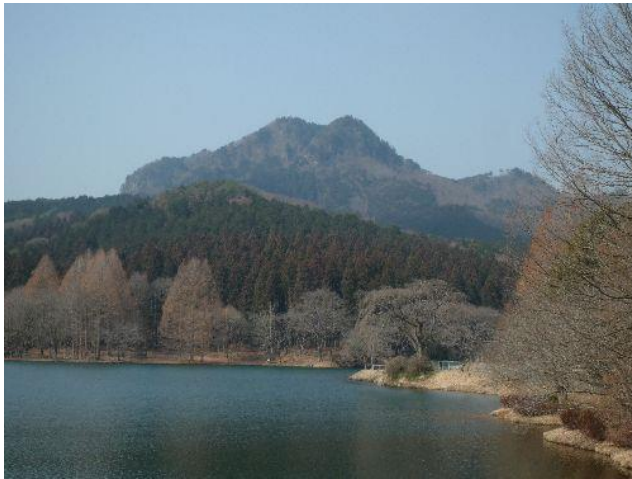
(赤川湖から古賀志山を望む)