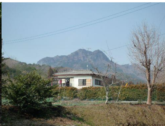
（古賀志山が見えて来る）