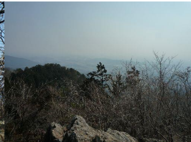
(春霞で日光連山が見えない)