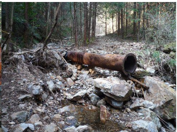
(登山道が荒れている)