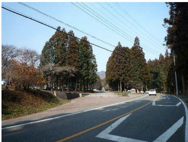
（森林公園が見えてきました）