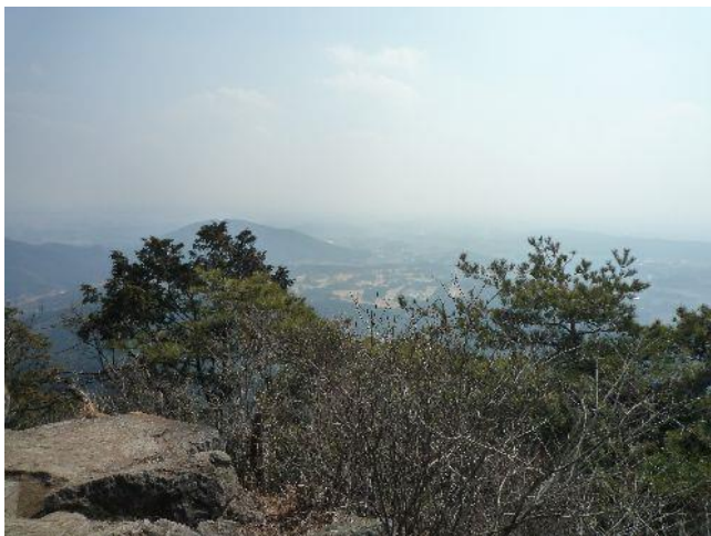
(東稜見晴台から宇都宮方向の眺め)

富士見峠から急登を行くと、東稜見晴台への分岐に出る。東稜見晴台にてしばし眺めを楽しむ。東稜を登るにはザイルが必要のようだ。