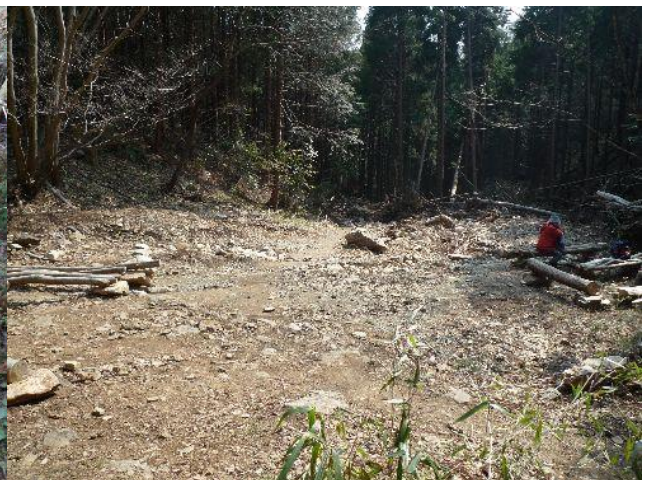
(休憩にいい広場。丸太製のベンチがある)