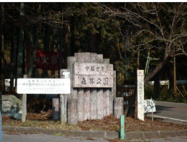
（森林公園に到着です）