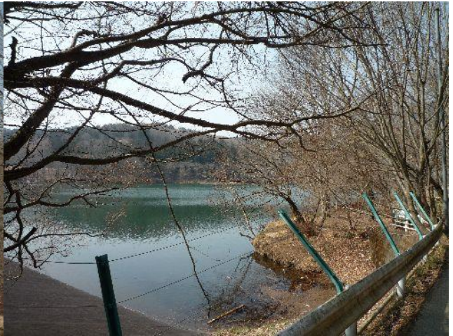
(赤川湖は農業用水のダムのような)

北登山コースは登山禁止の看板が立っている。が地元の登山者らしいパーティがどんどん入っていくので確認すると「行けるよ」とのこと。登山禁止の訳は今年の台風で登山道が荒れているためのようだ。