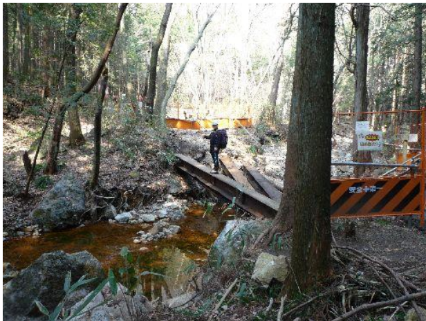
(細野ダムからの小川にかかる橋が流されている)

北登山コースは登山禁止の看板が立っている。が地元の登山者らしいパーティがどんどん入っていくので確認すると「行けるよ」とのこと。登山禁止の訳は今年の台風で登山道が荒れているためのようだ。