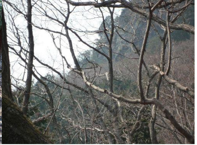
(上部の岩場が少し見える)

急な登山道を下り林道へ出てしばらく林道を歩き、さらに赤川湖への快適な登山道を行くと展望台へ出る。