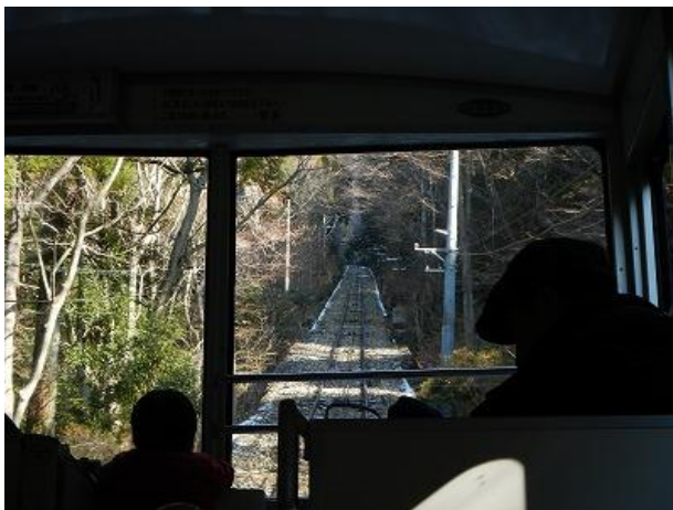
(ケーブルカーで出発)