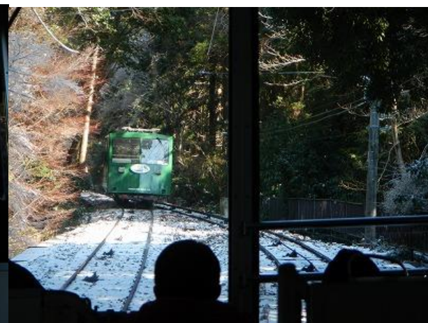
(下りケーブルカーとすれ違い)