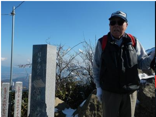
(じいじも登ったよ)