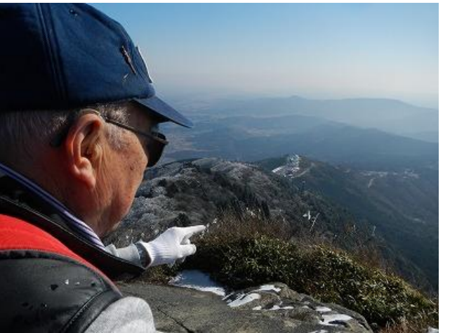
(あそこは霞ヶ浦だね)