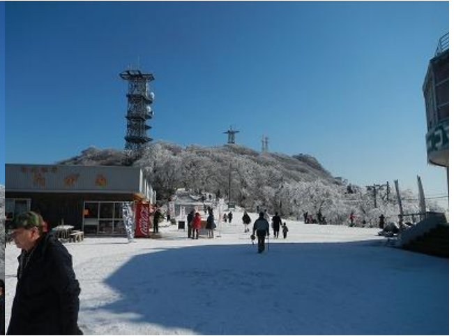
(女体山も真っ白だ)