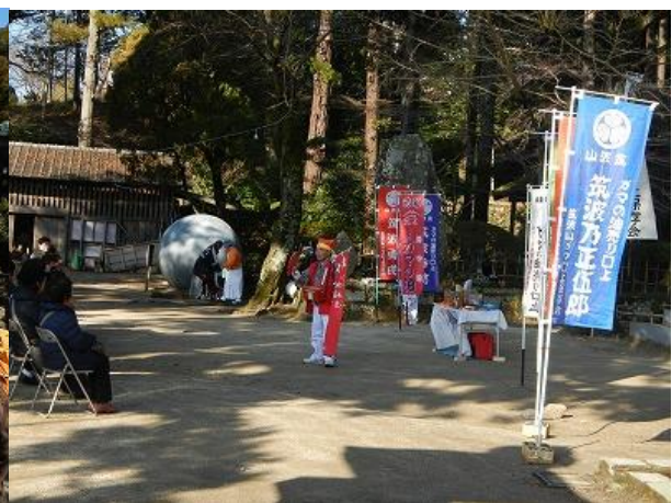
(「ガマの油? 売り」の口上)