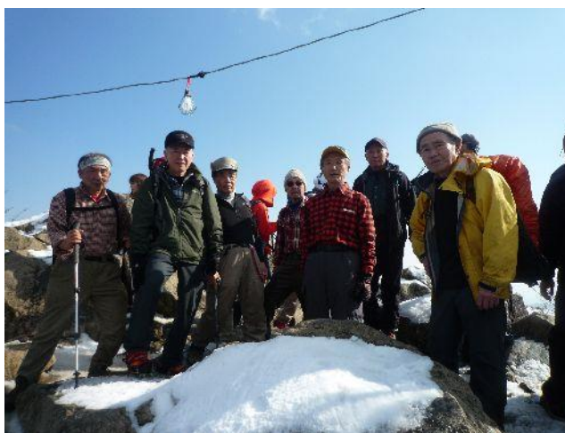
(女体山頂上にて記念撮影)

快適にアイゼンを効かせて、やがて女体山の頂上に到着。快晴で素晴らしい青空だが遠くはかすんでいて見えない。