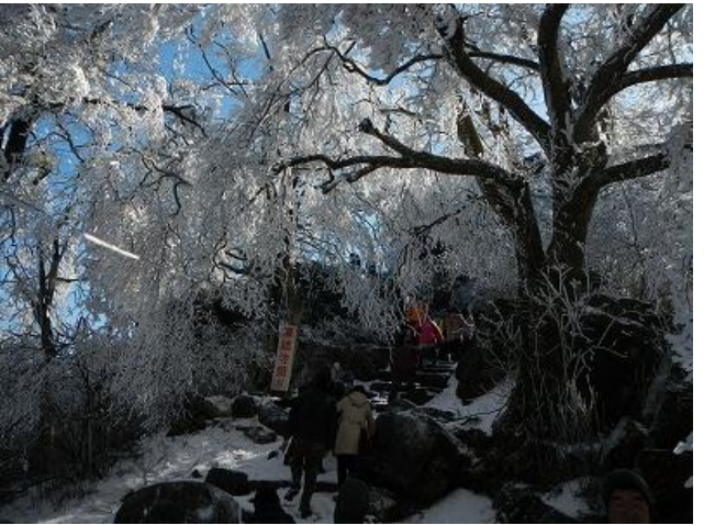
(しだれ桜みたいだ)