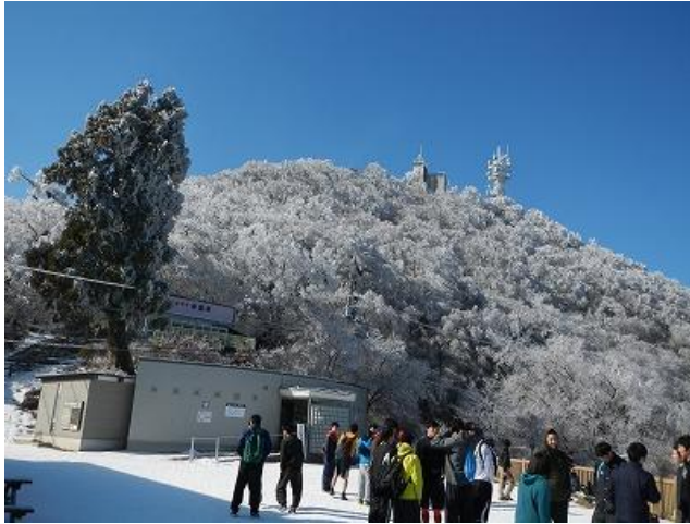
(男体山が真っ白だ)