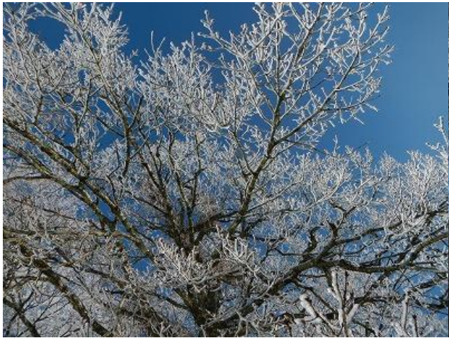
(雨水の花が咲いているね)