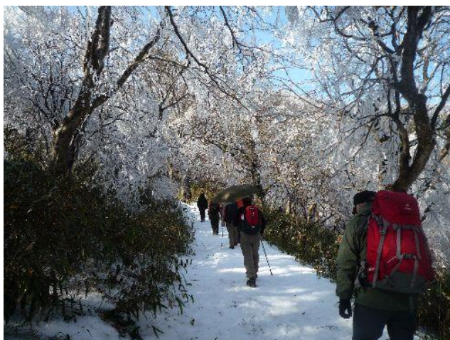
(雨氷の彩られた樹々の中を行く)

つつじヶ丘からのコースが合流する弁慶茶屋跡で一服し、ここでアイゼンを付ける。ここから筑波山名物の奇岩巨岩の連続だ。弁慶の七戻り、高天原、母の胎内めぐり・・・ 冬山なのにお天気が良いので登山客が多い。だんだんアイゼンが良く効くほどに雪が多くなってきた。青空に映える雨氷がきれいだ。